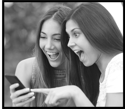
Les réseaux sociaux